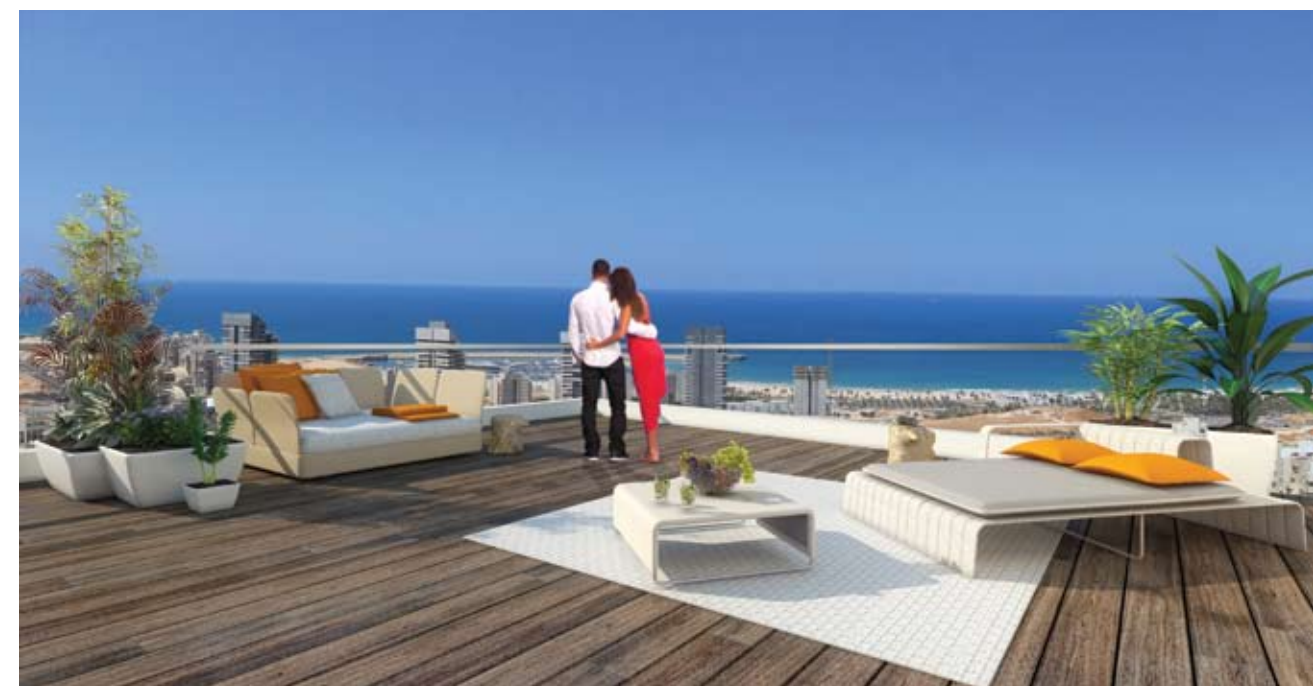
נוף פתוח לים מכל דירה! Sea view from all of the apartments!